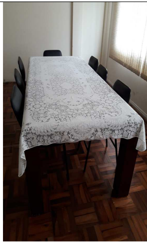
Mesa Sala Núcleos de Estudos