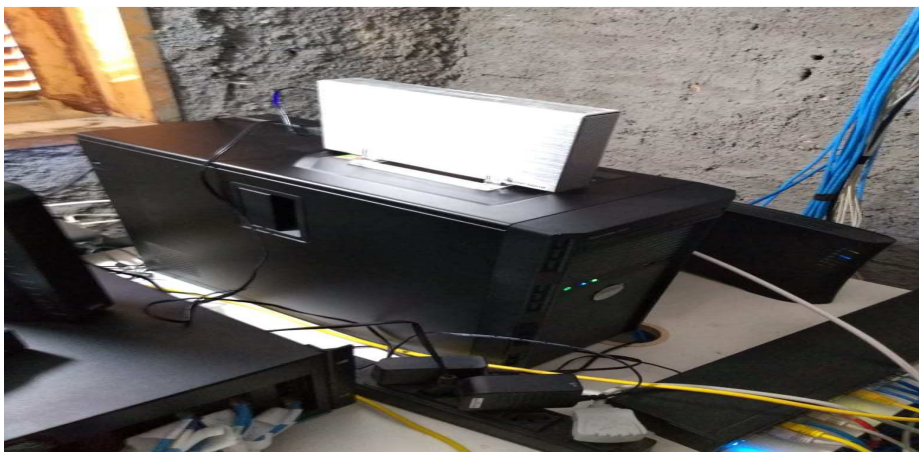
Imagem do roteador